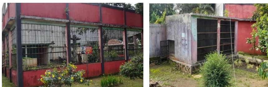
Gambar 2 Kondisi beberapa kandang mini zoo

Terdapat kesenjangan signifikan antara klaim pengelola dan kondisi lapangan. Observasi tidak menemukan angkutan umum reguler beroperasi di kawasan. Jalur menuju air terjun licin, terjal, dan rusak di beberapa titik tanpa pegangan tangan, bertentangan dengan prinsip aksesibilitas Purwaningrum dan Ahmad (2021) yang menekankan jalur ramah difabel dan papan informasi memadai. Temuan ini juga kontras dengan Priyanto, Suwena, dan Mahadewi (2023) yang menyebut aksesibilitas Curugsewu dalam kategori baik, perbedaan ini kemungkinan akibat kerusakan jalur pasca penelitian tersebut. Fasilitas disabilitas baru sebagian tersedia di pintu masuk kanan; perbaikan menyeluruh direncanakan pada anggaran 2026.