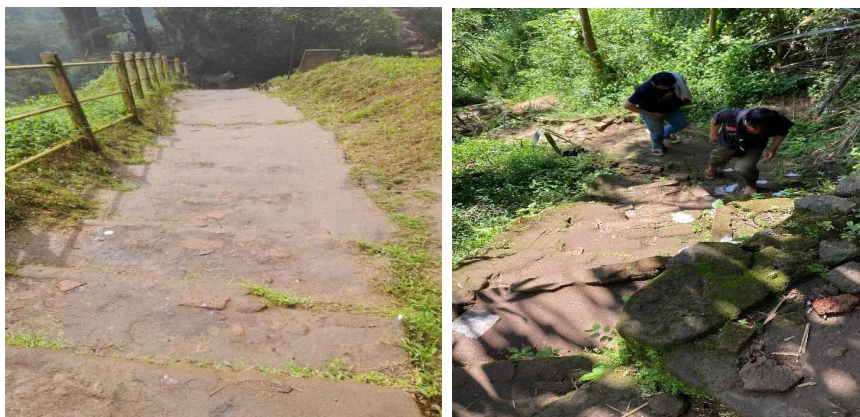
Gambar 3 Kondisi akses menuju air terjun

Terdapat kesenjangan signifikan antara klaim pengelola dan kondisi lapangan. Observasi tidak menemukan angkutan umum reguler beroperasi di kawasan. Jalur menuju air terjun licin, terjal, dan rusak di beberapa titik tanpa pegangan tangan, bertentangan dengan prinsip aksesibilitas Purwaningrum dan Ahmad (2021) yang menekankan jalur ramah difabel dan papan informasi memadai. Temuan ini juga kontras dengan Priyanto, Suwena, dan Mahadewi (2023) yang menyebut aksesibilitas Curugsewu dalam kategori baik, perbedaan ini kemungkinan akibat kerusakan jalur pasca penelitian tersebut. Fasilitas disabilitas baru sebagian tersedia di pintu masuk kanan; perbaikan menyeluruh direncanakan pada anggaran 2026.