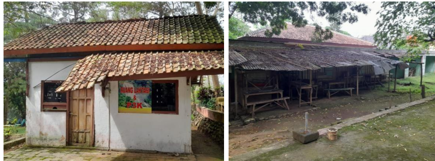
Gambar 4 Kondisi pos P3K dan Warung terbengkalai

Kapasitas akomodasi sangat terbatas dan belum sebanding dengan visi destinasi bertaraf internasional. Tidak terdapat hotel atau penginapan formal di dalam kawasan, dan tidak ada pelatihan resmi bagi pengelola homestay, sehingga konsistensi kualitas pelayanan tidak terjamin. Kesenjangan ini perlu segera ditangani seiring target internasionalisasi destinasi. Di sisi lain, aktivitas yang ditawarkan seperti sport tourism hanya beroperasi akhir pekan, bergantung cuaca, dan berharga relatif tinggi sehingga belum dapat diandalkan sebagai aktivitas utama yang konsisten. Wahana anak sangat minim sehingga segmen keluarga belum terlayani optimal. Belum tersedia aktivitas outbound harian seperti ATV atau flying fox yang tidak bergantung pada kondisi cuaca.