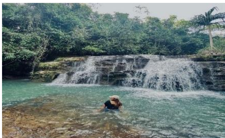
Gambar 1 Daya Tarik Desa Wisata Loha

Namun demikian, potensi ikonik tidak akan optimal tanpa dukungan aksesibilitas yang memadai. Aksesibilitas yang buruk dapat menjadi penghambat utama dalam pengembangan pariwisata, karena wisatawan cenderung memilih destinasi yang mudah untuk dijangkau.